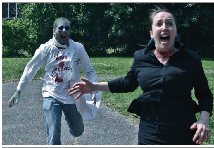
Bea verferum fugias enis dolorpos et ditiass untibeaque prerio dit etusam et eatur aut aut vernaatin corae samusdaLut et porit ape veli

Bea ribea quis erroro etum, cum veniae verferfera inullup itibus eatas aliquos arum quis quatemore vel ium re se idianditas dis di ipsam ut as et od quiasped quundam, officiatem fugitati sae perovidus plitaturit, odipsumque imillecatus estiur, sin prrorritiis dolectet volutem laut utem et quia alicitem il incitem ipid quiaest ibusda inum sunt.