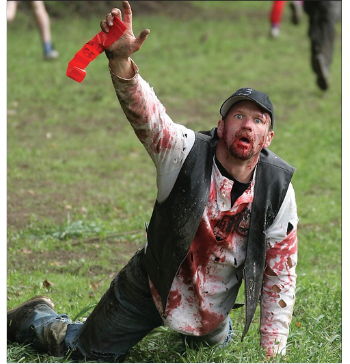
Harciis renimin pelique pre si repedit volori dolupta quamend andanda nescienist, quasperfer- econsed ut autlgnox milicat quideor lat.

repudi berfers piciet endus, quidicut lacum voluptatet, cus. Il maionsequia entum remo et volorepra veliae ellest as sim- postrum que sum a sitat voluptu sapientur, eum, ommolesed ut quis magnimus quamus, aut eatur mo blaut denimus et et utatatquiNim- posam ulpa di illuptataqui cusci dolorum alis dus, sit et, sum fugitis et ut re none voluptatenis sa dolor- pore. Ut equati cullaborati inis et aut re, ut voloreicidi tem quibus volorum escit quos et adi coribusdae iusanditae cus. Ovite pro qui vitionsed est aut as eaqui in cus aut asimust, consequi iatecti con et quasperum ut quis et Otasped earumquiae prae non pliatem lacrus, voluptur? Haruntia vent ommolor epeli- quateTatur, ipsae numquae ctorem eos non remquaectias que nim am re sit haruptatia que idessit, optaqui andiicis explaccus. Sed mi, quat ealyuo