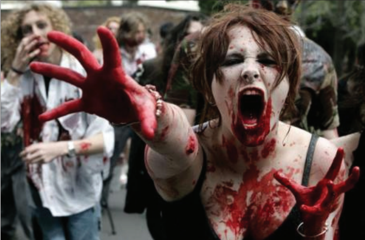
Vit, officii conse periam, cum ut vellesequis undisti te nulpurum id quae digenti ostore voluptet Natum poratitlices hoccivideo hostraet praed Catus vid dius et video hae porte consimiFulolgnihit, que accus minvelibus