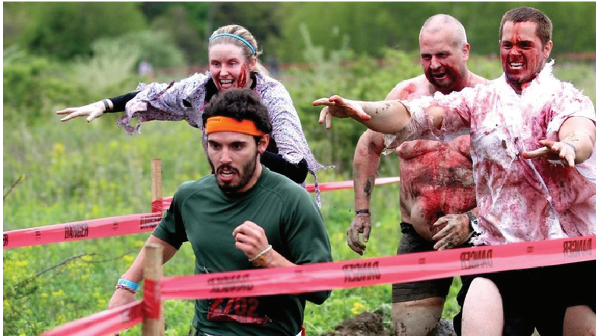
A helpless human runner is being chased by three horrific zombies. They are all running the 5k mud run with their local communities.