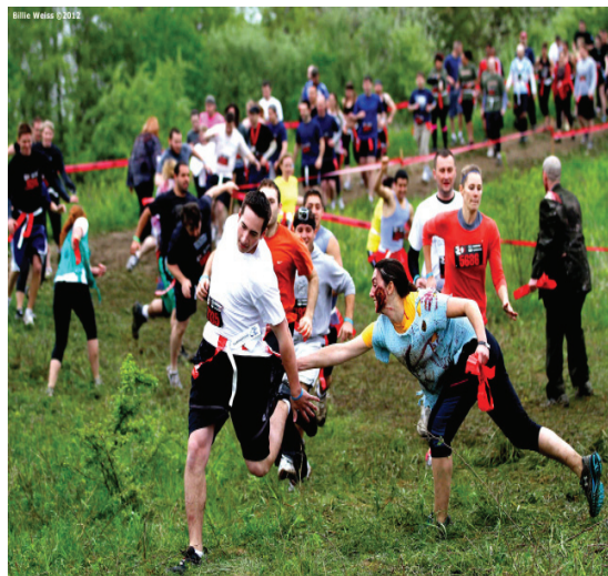
A Human runner desperately trying to escape the wrath of a Zombie. A Human runner desperately trying to escape the wrath of a Zombie.